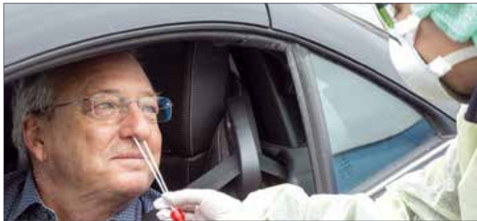
Ein Corona-Abstrichzentrum der Malteser als Drive-In.

Die Covid-Pandemie stellt den internationalen Malteserorden vor große Herausforderungen. „Der Orden ist ganz davon in Beschlag genommen, Krankenhäuser, Medizinzentren und Ambulanzen zu unterstützen und hilft gleichzeitig weiterhin älteren Menschen und solchen mit Behinderungen, die derzeit besonders gefährdet sind“, heißt es auf der englischsprachigen Homepage des Ordens. Tatsächlich ist der Malteserorden auf allen bewohnten Kontinenten tätig, so auch in Afrika und Asien. Malteser und ihre Partner sorgen dort mit jeweils unterschiedlichen Schwerpunkten nicht nur für medizinische Ba-