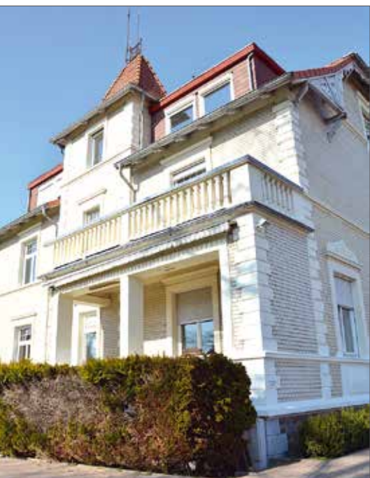
Das Alten- und Pflegeheim Villa Juesheide in Herzberg.

Und eine dritte kam noch hinzu: Wie erklärt man teilweise dementen Menschen die gewöhnungsbedürftige „Schwes-