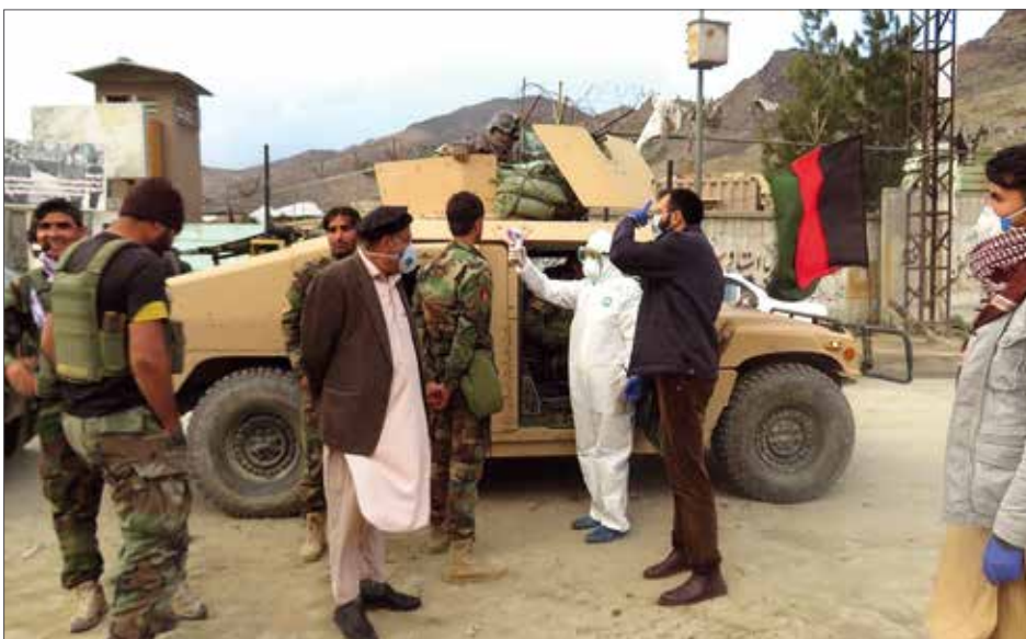
Mitarbeiter von Malteser International und ihren Partnern in Afghanistan.