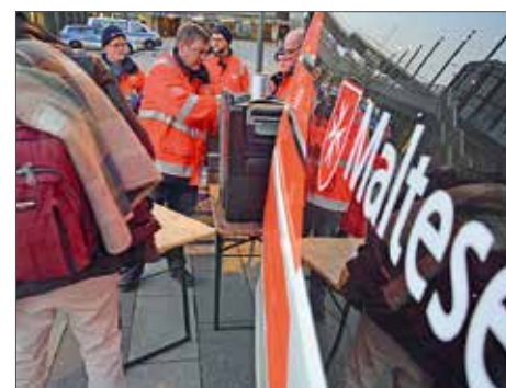
Abstand halten! Das Gebot der Stunde.